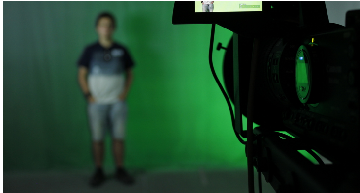
CEPRUD - Estudio de Grabación