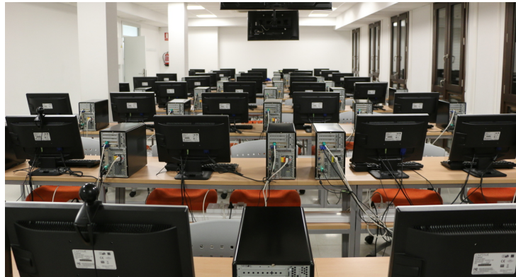
CEPRUD - Aulas de Formación