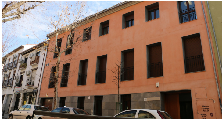
Centro de Producción de Recursos para la Universidad Digital (CEPRUD)