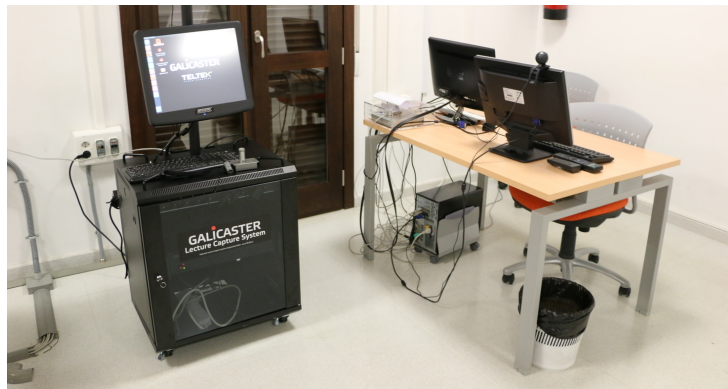
CEPRUD - Servicio GA3