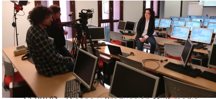
CEPRUD - Diseño y Producción Multimedia