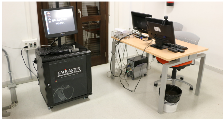
CEPRUD - Servicio GA3