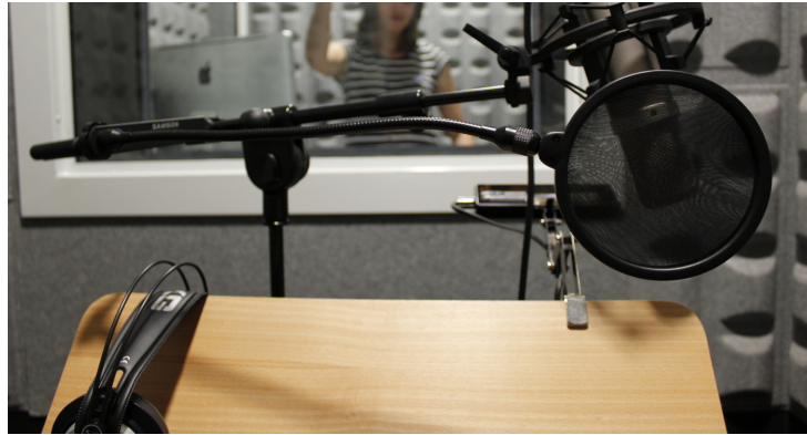
CEPRUD - Cabina Control Estudio Grabación