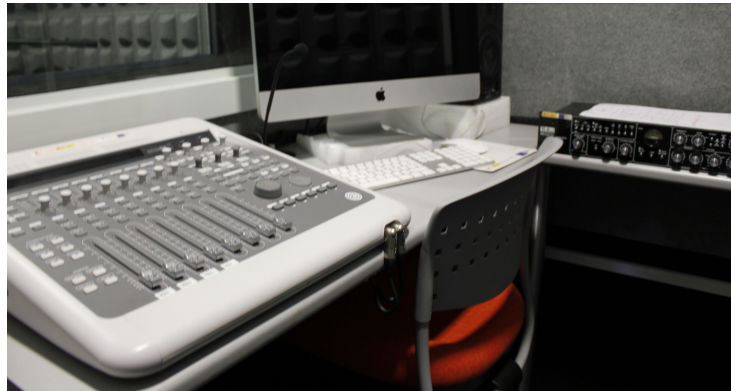
CEPRUD - Cabina Control Estudio Grabación